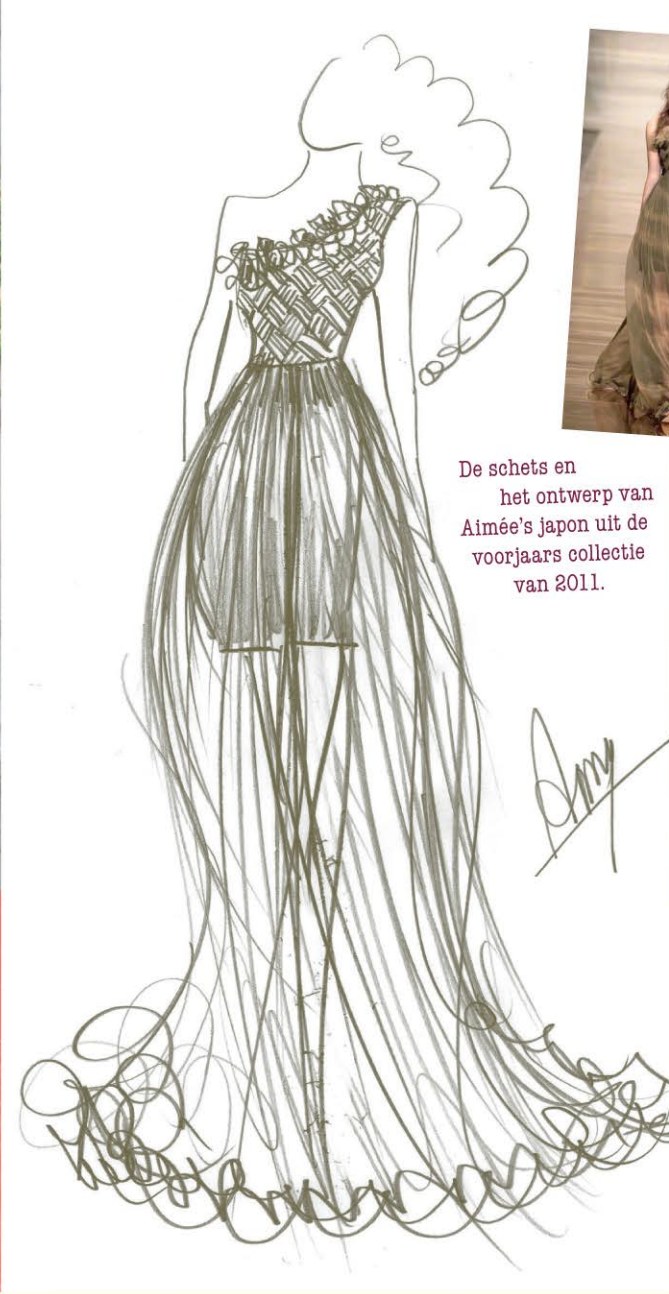
De schets en het ontwerp van Aimée's japon uit de voorjaars collectie van 2011.